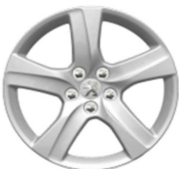
Jante alliage 16" Style 02