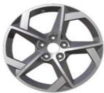
Jante alliage 17" Style 11 Diamantée Gris Anthra