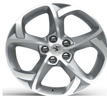
Jante alliage 17" Style 06