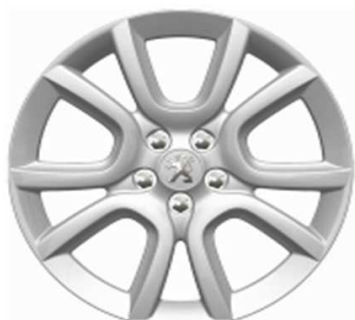
Jante alliage 18" Style 07 non chainable