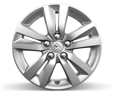
Jante alliage 16" QUARTZ