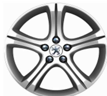
Jante alliage 18" Style 10 non chainable