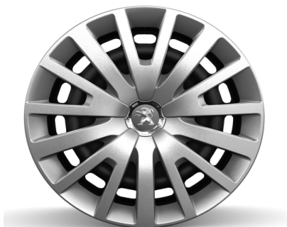
Enjoliveur 15" AMBRE